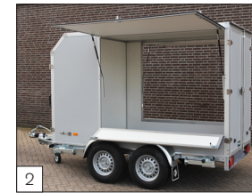
Option: links und rechts eine Seitenklappe und darunter ein Taschenträger montiert (Klappe ca. 20 cm nach unten aufklappbar), Aufbau in hellgrau an der Außenseite.