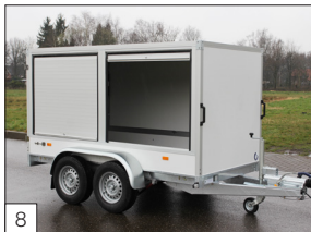
Option: 2 Aluminium-Schiebeläden (maximal 150 cm breit) in der Seitenwand inkl. Mittelpfosten.