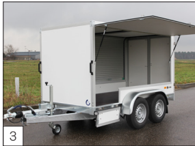
Option: Seitenklappe und vor dem Kotflügel eine Klappe, die sich nach unten aufklappen lässt.