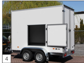
Option: Tür in der Seitenwand.