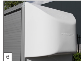
Option: Spoiler (Polyester) an der Vorderseite angebracht.