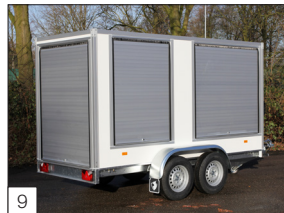
Option: Aluminium-Aufroll-Rolläden auf der Rückseite und Schiebeläden an den Seiten.