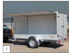
Option: Seitenklappe montiert, kann sowohl links als auch rechts (in Fahrtrichtung) angeordnet werden.