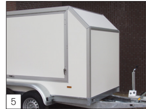
Option: abgeschrägte Front (gleicher Winkel von etwa 40 x 40 cm).