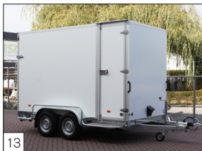
Option: Seitentür mit Scharnieren und Verschlüssen aus Edelstahl.