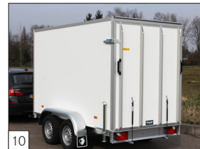
Option: Heckklappe mit Gasdruckfedern und doppeltem Verschluss links und rechts.