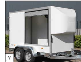
Option: Aluminium-Schiebelade in der Seitenwand.