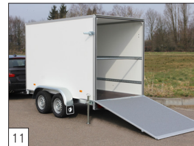
Option: Heckklappe mit grauer Anti-Rutsch-Beschichtung versehen.