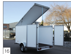
Option: aufklappbarer Deckel an der Vorderseite (möglich bis zu einer Größe von max. 300 x 150 x 180 cm).