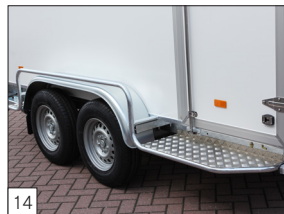
Option: Seitliche Schutzbügel mit Aluminium-Trittplatte.